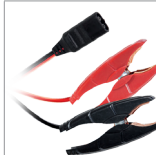
Pinces (35 cm)